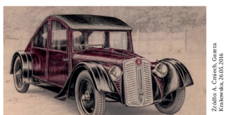
Zdjęcie: A. Chmielec, Galeria Fotografii, 2010

Wpisz poniżej sześcioliterową nazwę tego samochodu. Blisko SMFM-41 znajduje się obszerna tablica dotycząca pewnego szlaku naftowego, w którego nazwie pojawia się łańcuch górski i nazwa ziem dawnej Rzeczypospolitej pod zaborem austriackim. Wykorzystaj trzy pierwsze litery wspomnianych ziem i trzy pierwsze łańcucha, który znajduje się też w jednym z ważniejszych prac W. Pola – „Rzut oka na północne stoki ...”.